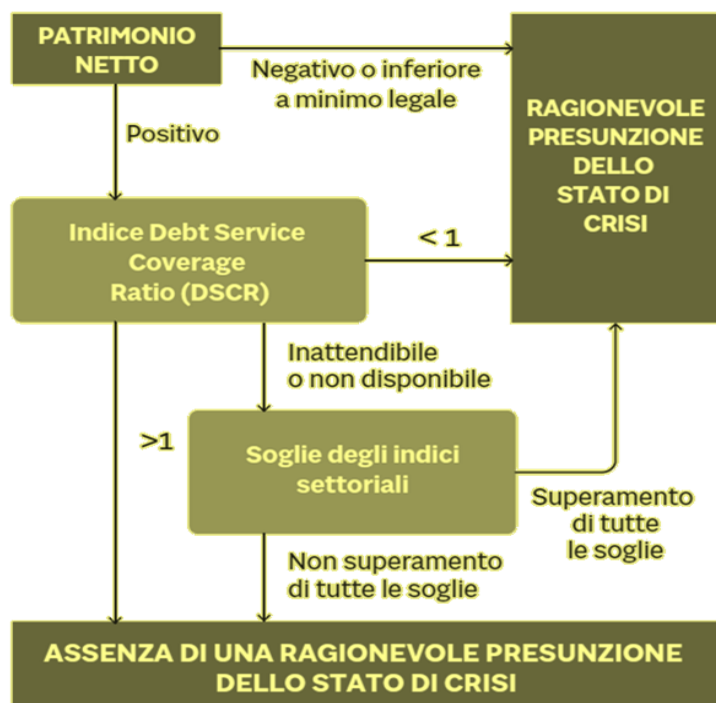
SISTEMA DEGLI INDICI DI CUI ALLA DELEGA ART. 13. C. 2 (PARTE 1)